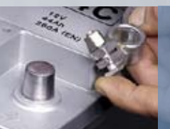
Polos forjados en frío