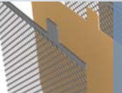
Rejillas con plata