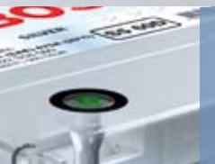
Power Control System