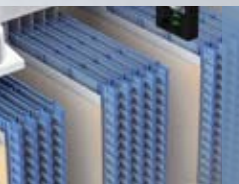
Separador de polietileno